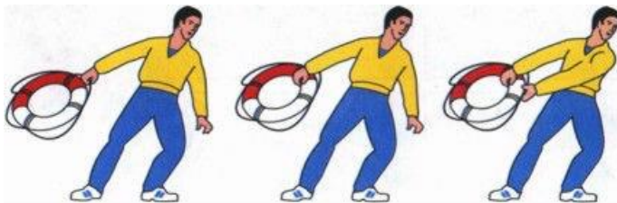
Рис.1 Способы подачи спасательного круга